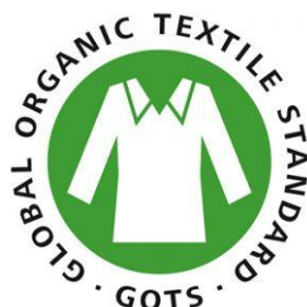
Imagen 2.