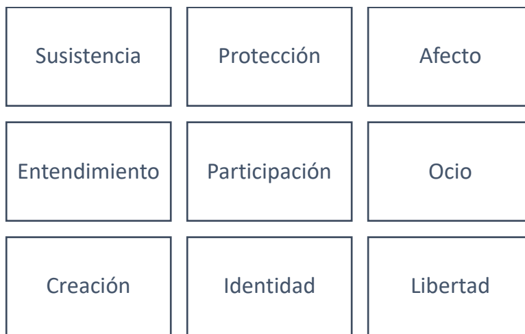
Gráfico 2.

Kate Fletcher (2012), como pionera en moda sostenible, estudia a partir de las investigaciones del economista Manfred Max Neef las necesidades que la moda sostenible satisface. De las nueve necesidades humanas que el economista describe, Fletcher considera que la moda sostenible se ocupa de cuatro de las nueve necesidades en concreto ya que “nos proporciona calor y protección (subsistencia, protección) y, unida a la moda, puede colmar nuestro deseo de expresión personal y de pertenencia (identidad) (...) El vínculo de la ropa al ocio tiene un carácter más ritualista que utilitario, ya que “ir de compras” se ha convertido en una forma más de pasar el rato y se hace de forma regular” (Fletcher, 2012, págs. 132-133).