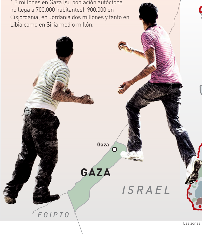
Rafael Navarro / Revista Española de Defensa. Fuentes: Naciones Unidas, Acuerdos de Oslo, The Economist, SIPRI, Universidad Judía de Jerusalén, El Mundo, elaboración propia.