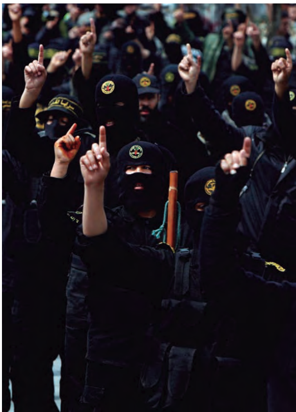
Miembros de la milicia palestina de Hamás en 2010, su época más violenta en el enfrentamiento con Israel.

Después de los seis días de la fulminante guerra entre Israel y sus vecinos árabes, Tel Aviv se convirtió en un actor con una importante ventaja estratégica y militar en el conflicto de Oriente Próximo. Los territorios conquistados a Siria, Jordania y Egipto eliminaron definitivamente la opción de la invasión árabe, pero introdujeron la semilla de la violencia en su propio territorio. Este hecho condenó a las futuras generaciones de israelíes a vivir en un permanente estado de guerra.