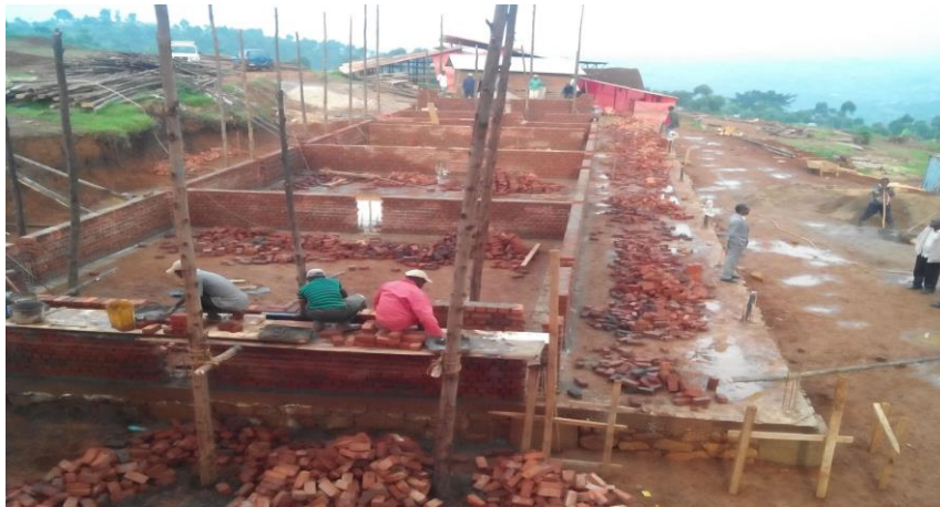
Construcción Colegio Príncipe de la Paz Beni/Kivu Norte