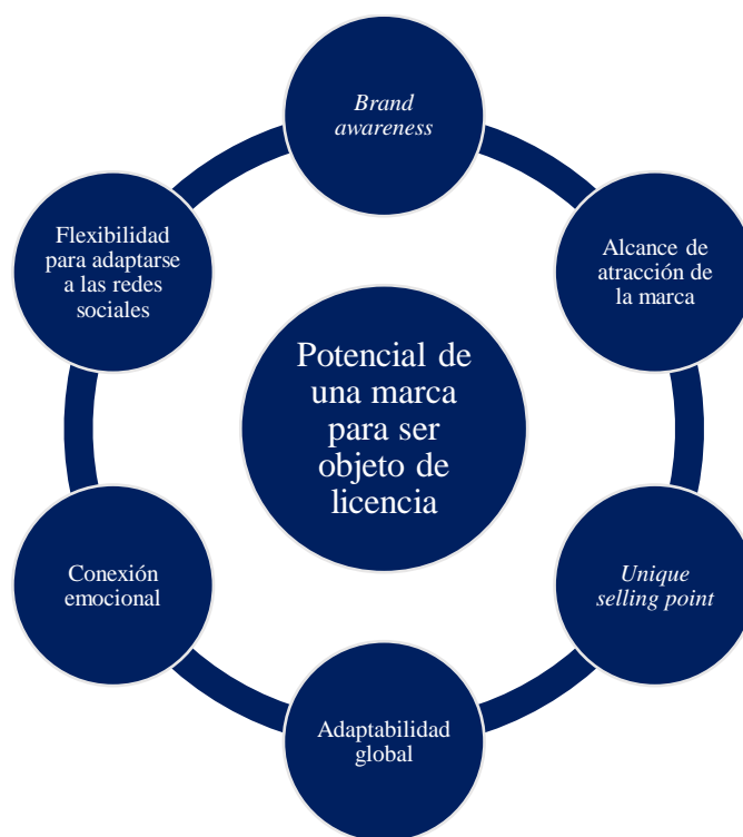
Ilustración 1. Potencial de una marca para ser objeto de licencia