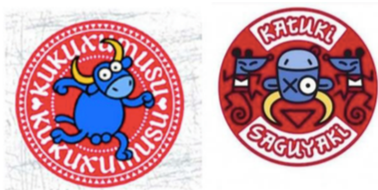
Figura 3: A la izquierda una imagen de Kukuxumsu y a la derecha el diseño de Mikel Urmenera.