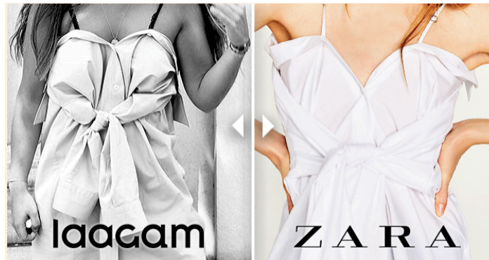
Figura 4: Caso Laagam vs Zara.

Fuente: Ballfugó, C. (2017, 3 de junio). Laagam reclama a Zara la retirada de una de sus prendas por plagio. Crónica Global .