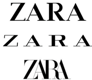
Figura 1: Evolución logos de ZARA