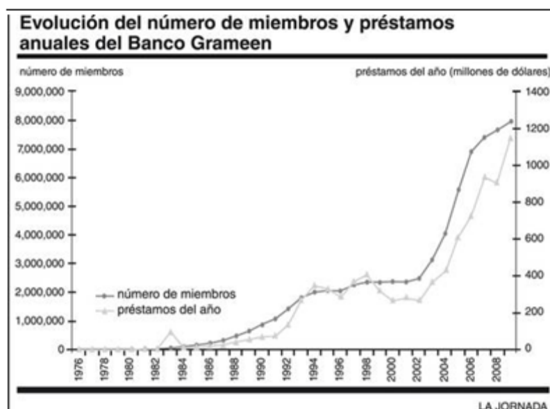
Gráfico2: Evolución del número de miembros y préstamos anuales del Banco Grameen