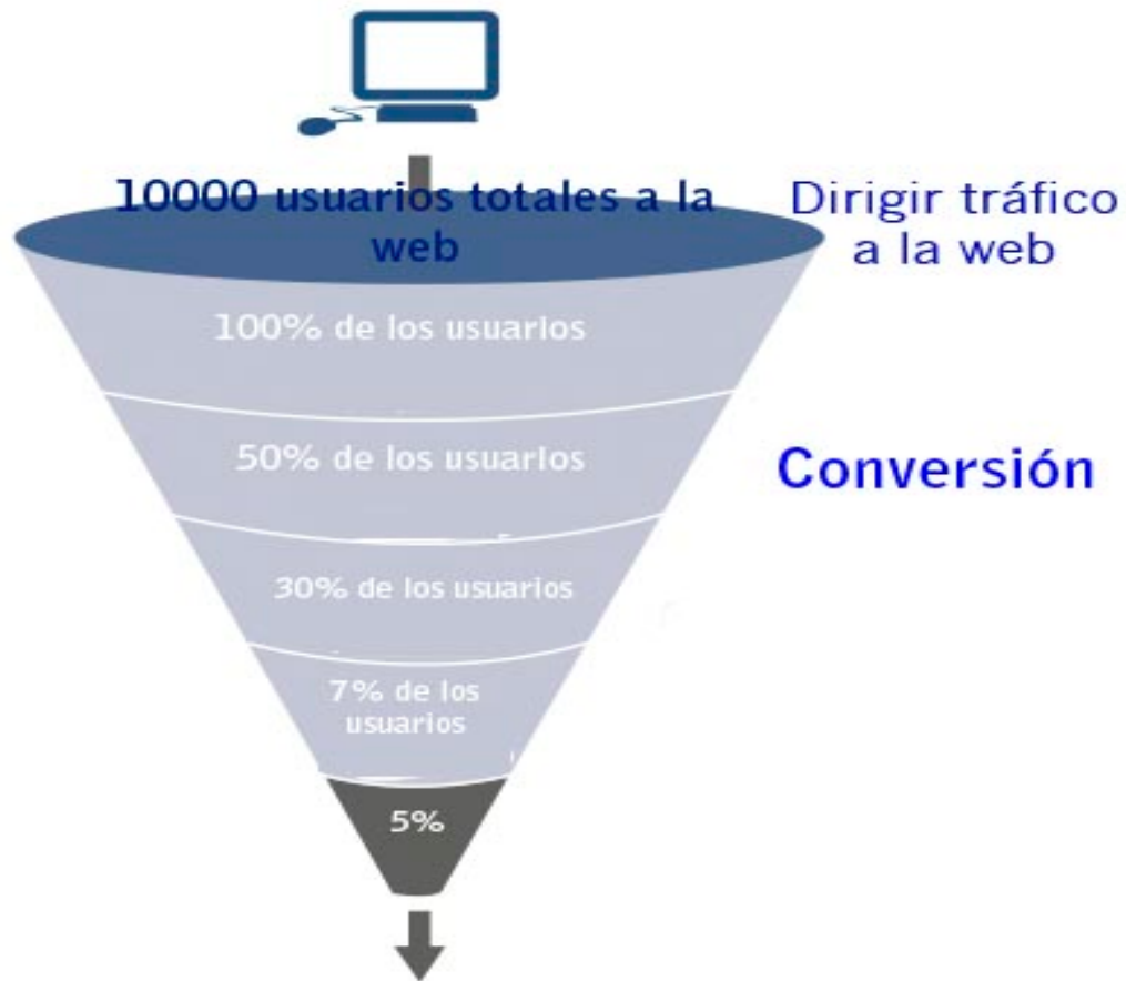
Ilustración 3: Sistema de Funnel o embudo