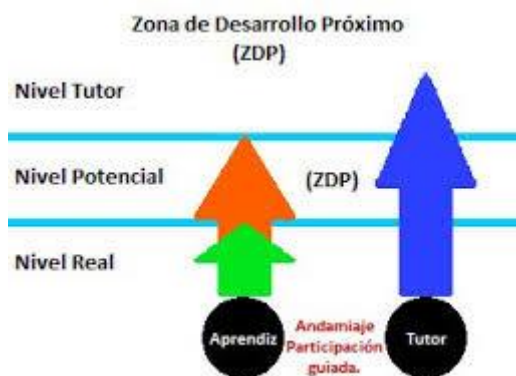
Figura 1: Representación de la Zona de Desarrollo Próximo.

explotar su potencial. Debe permitir que el alumno cometa errores, aprendiendo así a superar las dificultades que surjan durante el proceso. El error es un aspecto didáctico crucial para el niño/a durante su etapa educativa. Enseñar a gestionar el fracaso o la frustración es una meta didáctica que encuentra en la Educación Física una oportunidad excelente. La cooperación o soporte que el alumno necesita debe ser el paso previo hacia una autonomía total, siempre y cuando esté preparado.