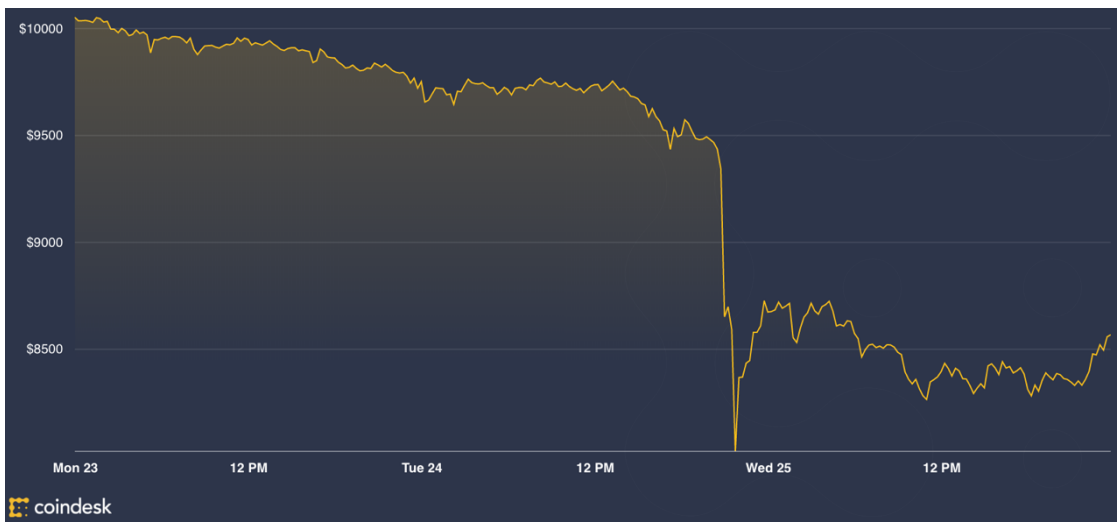
Figura 5: Precio del bitcoin (23/09/2019 – 25/09/2019).

Debemos recalcar que el riesgo del precio del bitcoin no radica en una cuestión a largo o, incluso, medio plazo. Es más, la alta volatilidad del bitcoin se refleja en periodos tan cortos como pueden ser los días. Durante los días 25 de octubre de 2019 al 27 de octubre de 2019, el bitcoin sufrió una subida de precio desde los 7.410 dólares el 25 de octubre a las 07:29, hasta los 10.313 dólares el 26 de octubre a las 03:45, lo cual supone un aumento del precio del 39,18% en menos de 24 horas (Coindesk, s.f.).