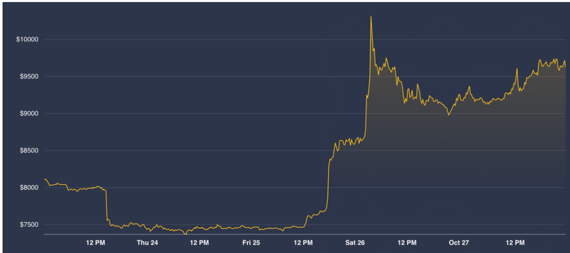
Figura 4: Precio del bitcoin (24/10/2019 – 28/10/2019).