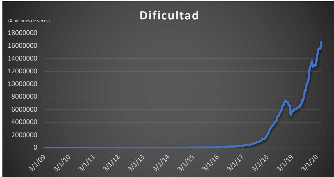
Figura 1: Medida relativa sobre la dificultad de resolver el problema Hash en comparación con la dificultad de resolverlo en el año 2009 (2009-2020).

Fuente: Elaboración propia a partir de datos y gráfico encontrado en Blockchain.com.