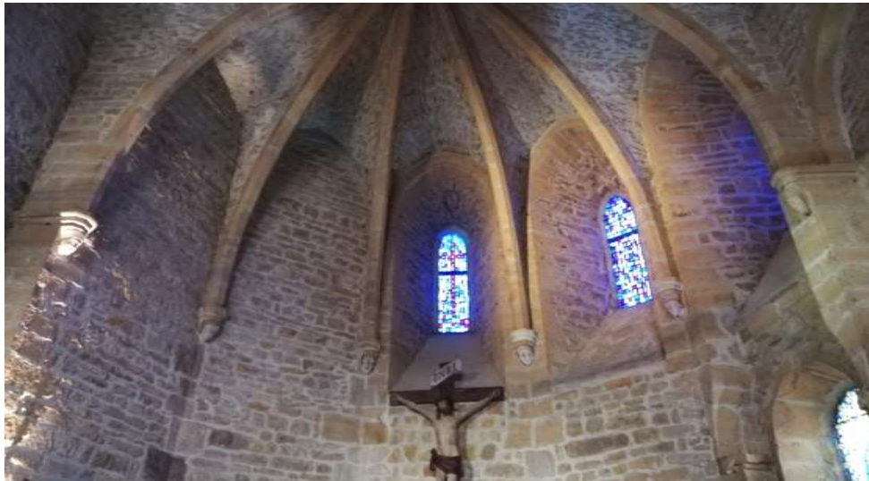
Figura 3. Iglesia de San Mateo, siglo X. Edificio más antiguo de Oingt. El coro está decorado con ocho bases esculpidas representando rostros. Según la tradición se trataría del padre de Margarita, Guichard IV, su esposa Margarita y sus seis hijos vivos en 1297.