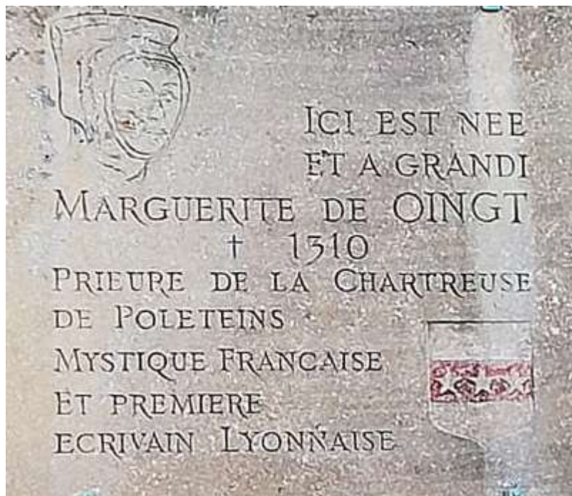
Figura 2. Placa conmemorativa de Margarita de Oingt ubicada en la Puerta de Nizy, Oingt.