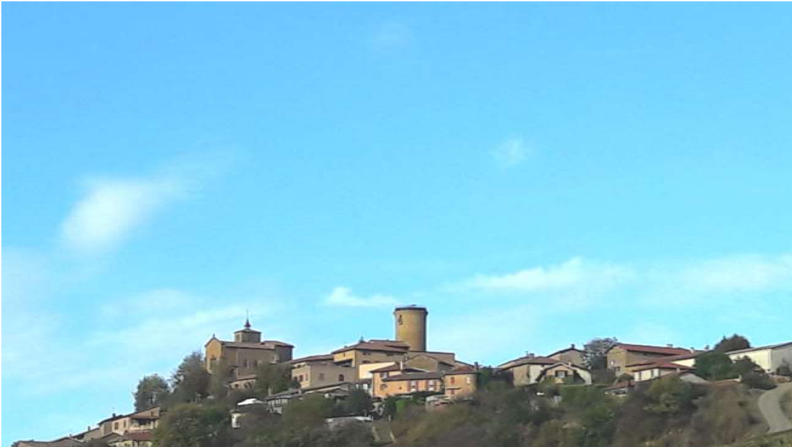
Figura 1. Pueblo de Oingt. Se pueden apreciar la actual Iglesia de San Mateo, siglo X, antigua capilla del “ Château Vieux ” y el “ donjon ” del “ Château Neuf ”, construido en 1190 por los Señores de Oingt 1 .