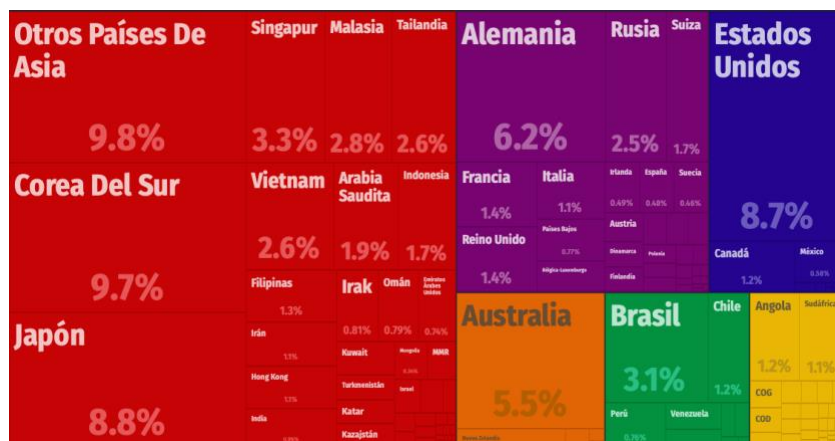
Figura 3: Gráfico de OEC: Orígenes de las importaciones de China (2017) (OEC, 2020).

Kenia exporta a China mayormente materias primas, en especial, minerales. Las exportaciones de Kenia destinadas a China representan el 2,1% de su total, un número no muy alto comparado con el 8,7% de las exportaciones que Kenia destina a Estados Unidos (figura 4). Y a pesar de ser el principal destino de sus exportaciones, a Estados Unidos no se le acusa de ejercer neocolonialismo en Kenia.