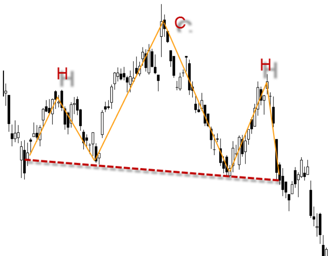
Figura 2: Gráfico de Velas