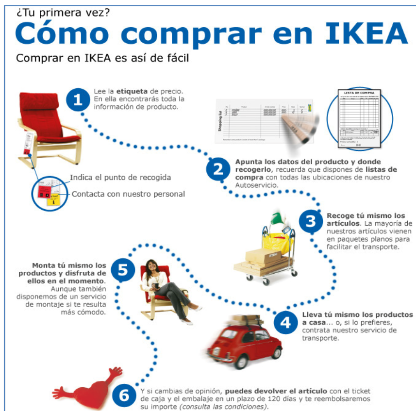
Ilustración 2. DIY - Comprar en IKEA.

En el apartado 3.2.1 sobre la oferta de muebles, IKEA está posicionada como la empresa líder en su sector en la mayoría de los mercados, en gran parte, gracias a su estrategia de precios bajos. Esta se limita a controlar a la competencia y mantener las reducciones de precio al mínimo. Dahlvig (2012) afirma que la gente es consciente que menos servicios implica un menor precio de venta y que las personas que necesitan dichos servicios (transporte, montaje) están dispuestas a pagar más. Es aquí donde entra en juego la importancia del DIY y la famosa estrategia de self-service que permite a la compañía mantener los costes bajos (Wei & Zou, 2007). Si es cierto, que este concepto no ha tenido la misma acogida en todos los mercados en los inicios de IKEA en el país en cuestión.