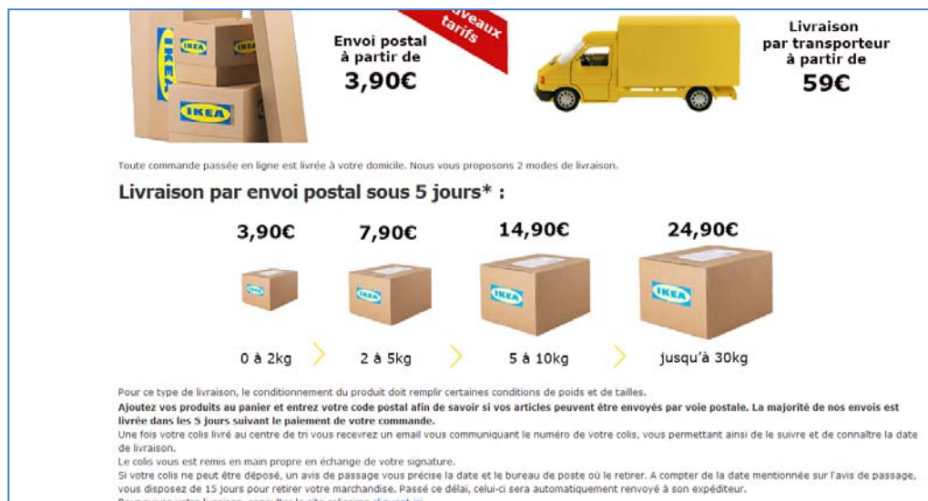
Ilustración 3. Tarifas del servicio de envío del pedido a través de la tienda online .

A parte de elevado tiempo de espera, el cliente tiene que asumir unos gastos de envío bastante elevados.