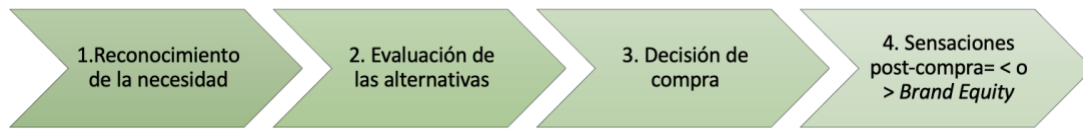
Ilustración 1: fases del proceso decisional de compra