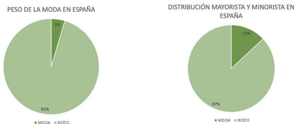
Gráfico 2: Gráficos del peso de la moda en la industria española manufacturera