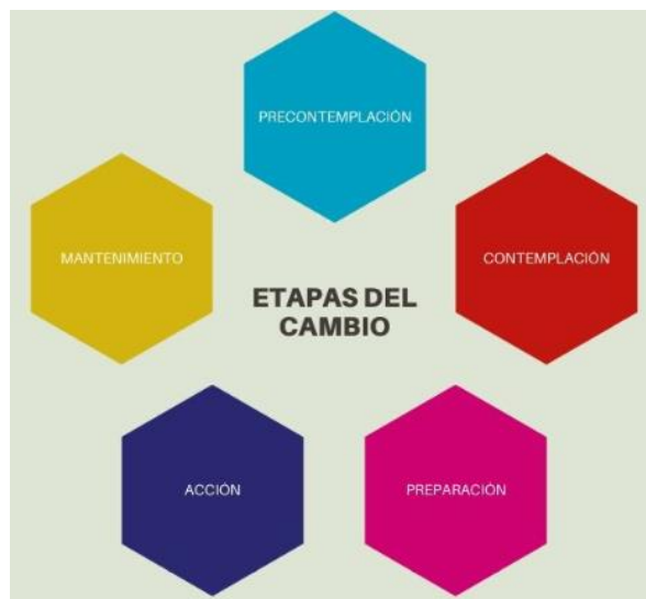
Figura 2. Etapas del cambio de DiClemente y Prochaska. Adaptado de Vogel, Rubinstein, Prochaska & Ramo (2018).