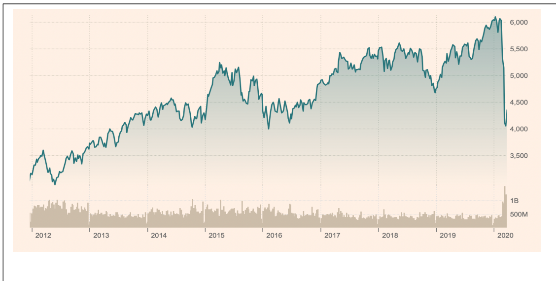
Figura 4. Volumen de negociación del CAC 40, 2012-2020