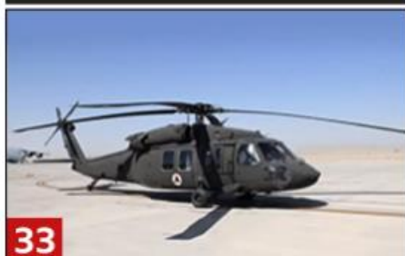
Helicópteros UH-60 Black Hawk