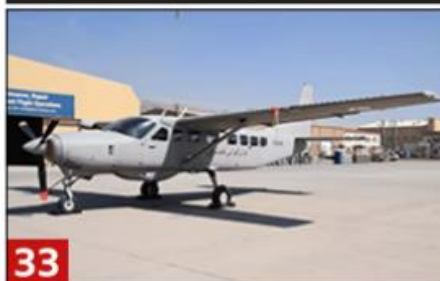
Aviones C-208 / AC-208