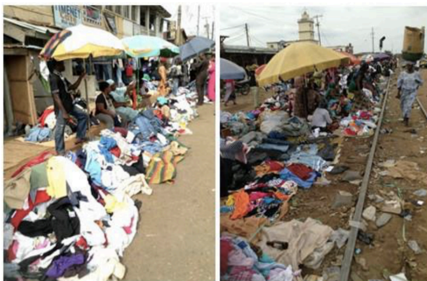
FIGURA 1 : Mercado de Segunda mano en Nigeria.