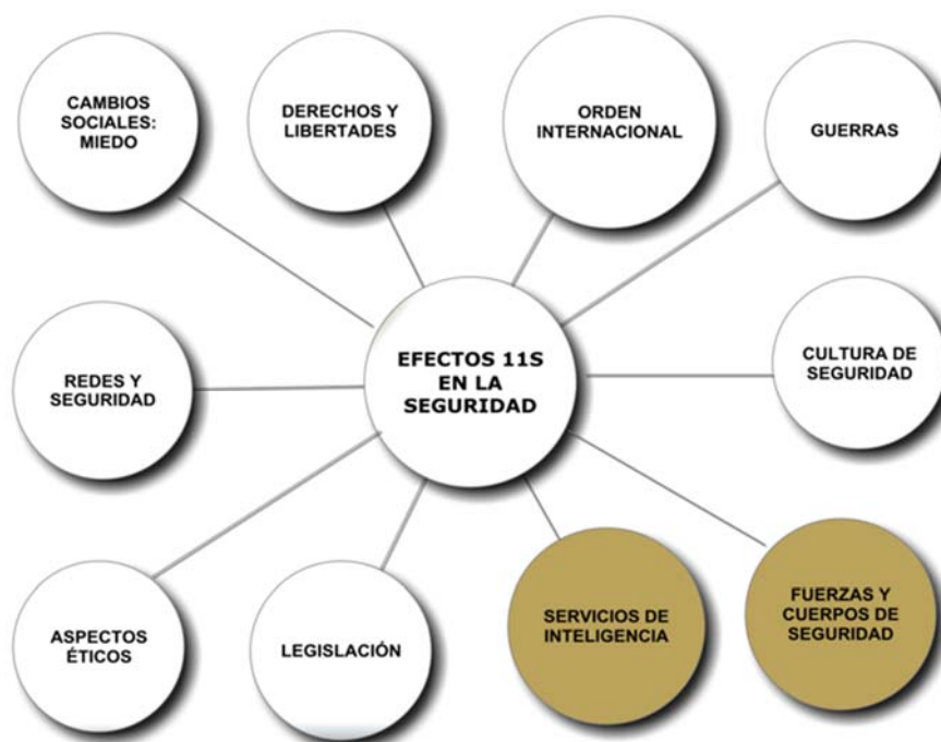
Figura 1: Efectos de los ataques del 11-S en el ámbito de seguridad internacional