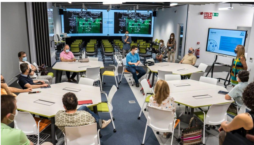
Imagen 2. Sala Comillas Conecta Lab 40

Intercultural; o, por su parte, las que se basen en trabajo en grupos, creemos que es importante que el espacio donde se imparten invite a hacer esto. Por ello, recomendamos que los docentes hagan uso de los espacios que la Universidad pone a su disposición, recientemente en 2021 ICADE abrió un espacio que se llama Comillas Conecta Lab, en la calle Galileo que, a nuestro juicio, es idóneo a estos efectos. Esta cuenta con mesas integradas con enchufes, así como con ruedas. al igual que las sillas y las pizarras, permitiendo ponerlas en la disposición que mejor fomente el desarrollo de la clase, y fomentando un aprendizaje activo