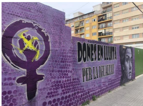
Ilustración 1. Delito de odio manifestado en vía pública

En primer lugar, los delitos de odio en el espacio público pueden representarse en pintadas de las fachadas públicas o en las fachadas de propiedad privada. Igualmente, también puede cometerse en lugares de culto en forma de blasfemia. Ejemplo de ello lo podemos ver en la esvástica pintada en un mural dedicado a las mujeres en Gandía (Valencia).