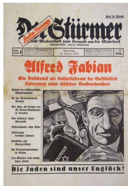
Ilustración 1: discurso de odio contra los judíos en el periódico Nazi Der Stürmer 79

La propagación del discurso de odio ha tomado muchas formas a lo largo de la historia a medida que han evolucionado las plataformas de medios. Los nazis utilizaron periódicos virulentamente antisemitas como Der Stürmer para ayudar a incitar al pueblo alemán a la persecución activa de los judíos. Cinco décadas después, durante el genocidio de 1994 en Ruanda, la emisora de radio RTL M jugó un papel clave promoviendo el discurso de odio contra los tutsis, incitando al genocidio e incluso dirigiendo a los asesinos con nombres de posibles víctimas que aún no habían sido asesinadas.