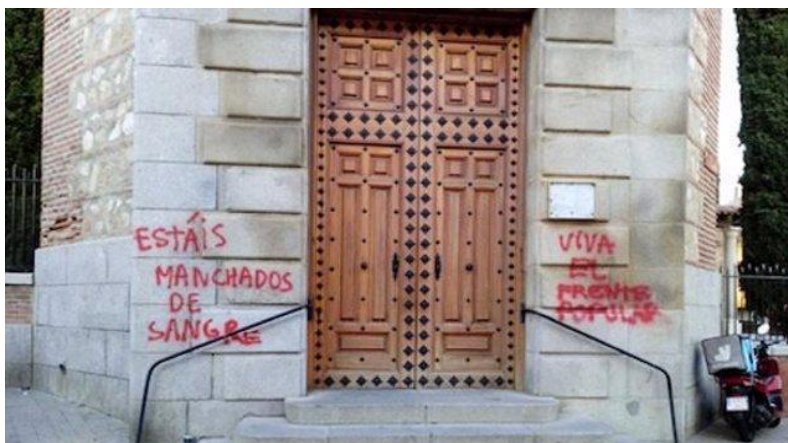
Ilustración 2. Delito de odio manifestado en lugar de culto en 2018