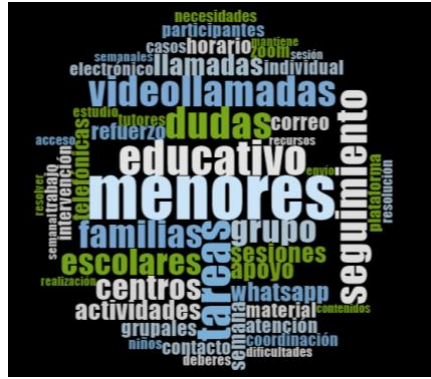
Figura 2. Gráfico de nubes de las 50 palabras con mayor frecuencia en el Programa Refuerzo Educativo