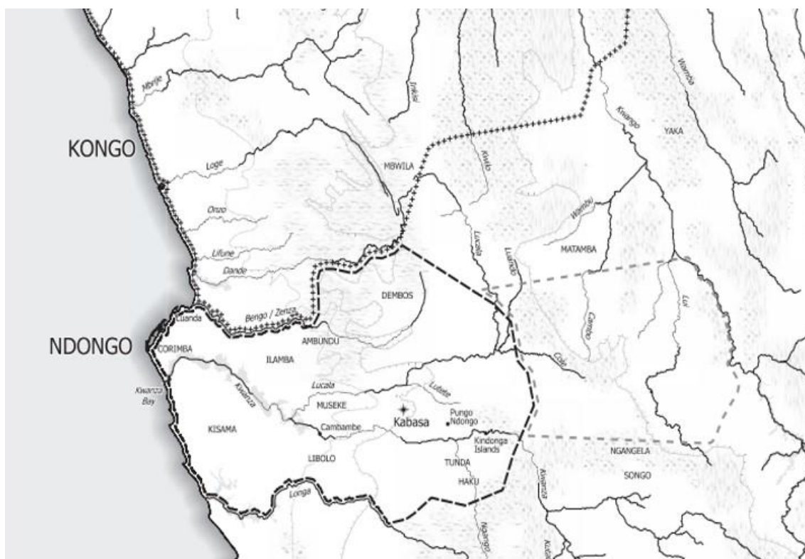
Mapa II: Reino do Ndongo (ca. 1550).

Os ind3cios da presen3a humana na regi3o centro-oeste do continente africano indicam que por volta de 1200, muito provavelmente como resultado das migra3es para sul de povos do grupo lingu3stico bantu, os primeiros grupos humanos come3aram a estabelecer-se na regi3o do actual territ3rio da Rep3blica de Angola. Muitos destes grupos, tendo a l3ngua e os la3os familiares como principal v3nculo de coes3o, adoptaram uma grande diversidade de formas de organiza3o pol3tica e social. Em alguns casos, esta pluralidade organizacional baseou-se, em crit3rios de extens3o territorial, de micro-