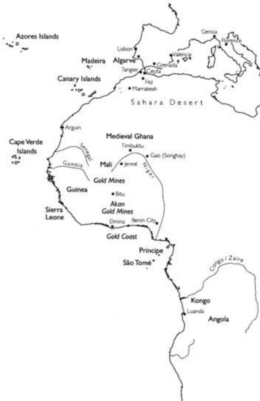
Mapa III: Costa Occidental Africana (ca. 1550).