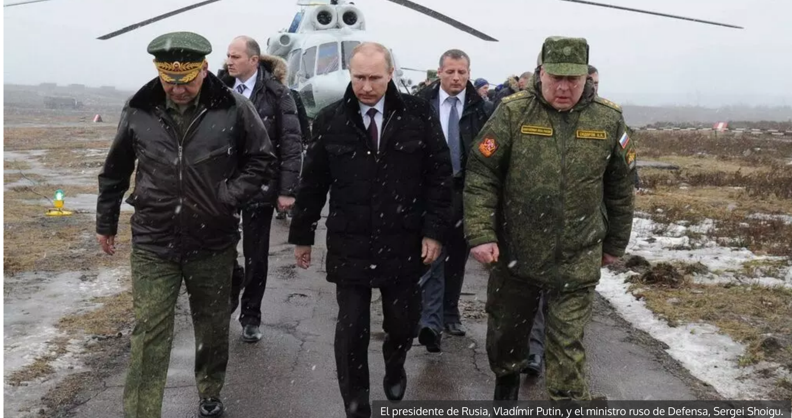
El presidente de Rusia, Vladimir Putin, y el ministro ruso de Defensa, Sergei Shoigu.

¿Qué objetivos espera alcanzar Rusia con esta tensa espera? ¿Por qué no ha invadido ya Ucrania? Todas estas preguntas tienen una respuesta común