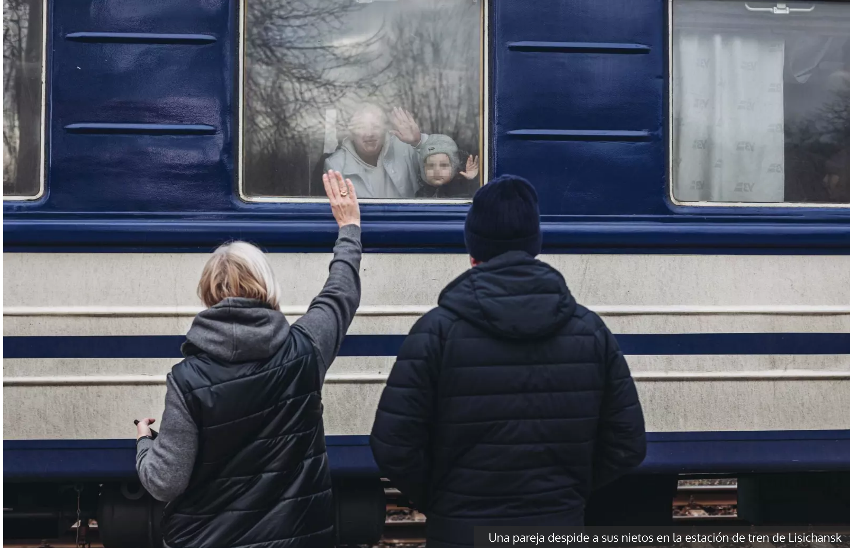
Una pareja despiden a sus nietos en la estación de tren de Lisichansk

Suponiendo que Rusia pueda consumir la conquista con éxito, le va a resultar muy difícil mantener el orden público y la paz social