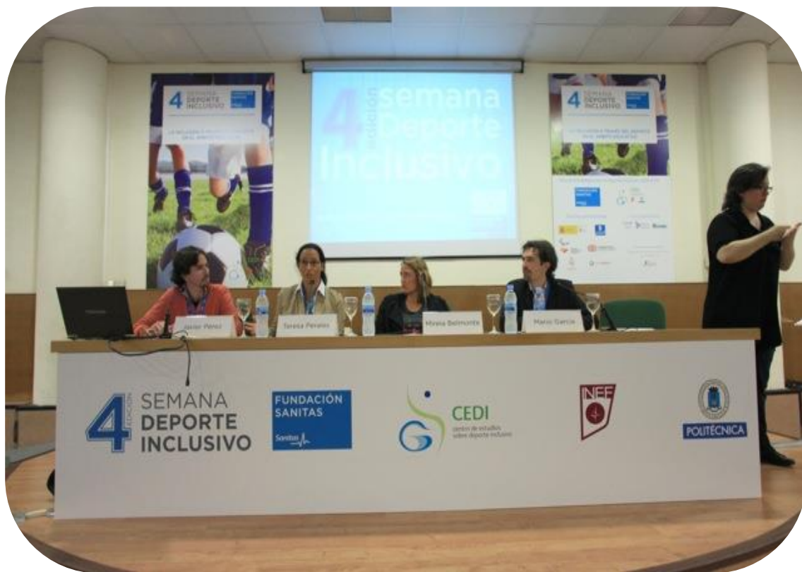
Fotografía 5. Mesa redonda. Teresa Perales y Mireia Belmonte

Teresa Perales , Nadadora Paralímpica Española