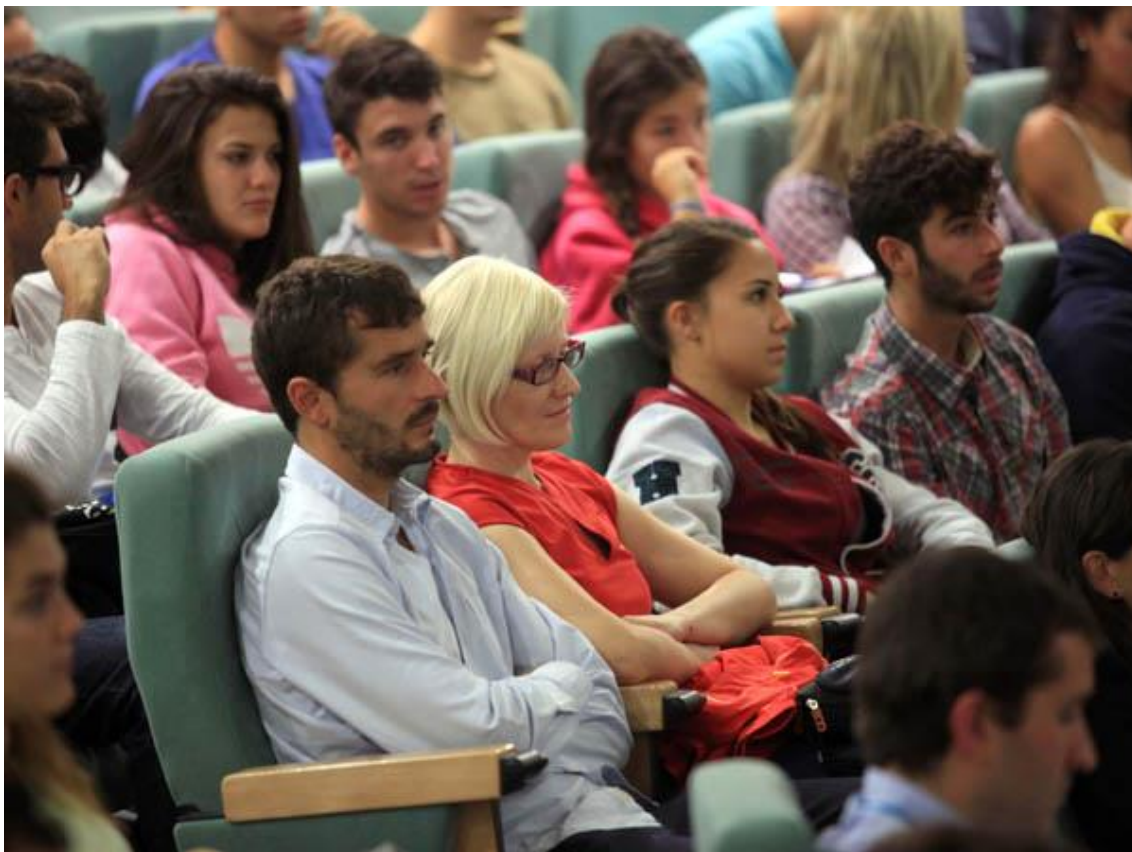
Fotografía 4. Asistentes a la IV Semana del Deporte Inclusivo 2013