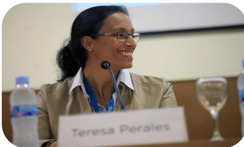
Fotografía 7. Teresa Perales

Mireia Belmonte. Lo primero que me gustaría comentar es que me sentí muy privilegiada por estar ahí, primero por poder compartir cuatro días con los mejores deportistas que hay y ha habido en España, como el caso de Fermín Cacho, Teresa Perales... Recuerdo que antes de ir a Buenos Aires nos sentíamos muy contentos ya que teníamos en la cabeza ganar o estar prácticamente en la segunda ronda. Una vez que vimos que estábamos eliminados en la primera ronda fue un poco triste para todos; aun así, considero que se hizo un buen trabajo y los españoles estábamos muy ilusionados. Creo que fue muy positiva dicha vivencia ya que fue un acto que sirvió para unir al país por conseguir el sueño Olímpico.