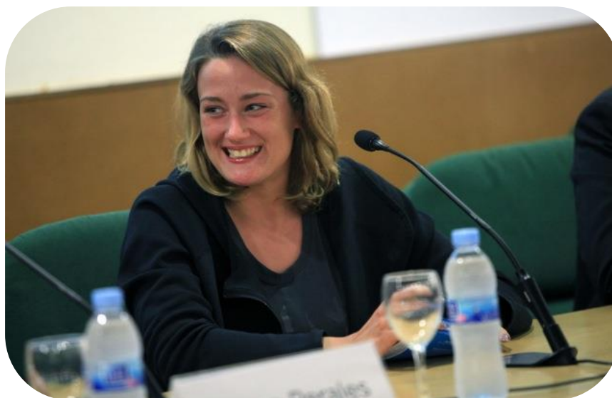
Fotografía 6. Mireia Belmonte