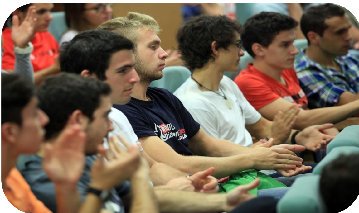
Fotografía 23. Público asistente a la IV Semana del Deporte Inclusivo

Actualmente son pocos los videos que disponemos con subtítulos debido a que ya venían así. No obstante, desde el CEDI con su actual página web se hace totalmente accesible tanto para personas con discapacidad auditiva como visual. Por otro lado, en el DIE colabora una entidad que nos ayudó a subtítular el material que proporcionábamos en dicho proyecto. Con esto quiere decir que queremos incluir a dicha entidad para que colabore con nosotros en la subtitulación del archivo para dar accesibilidad a todas las personas.