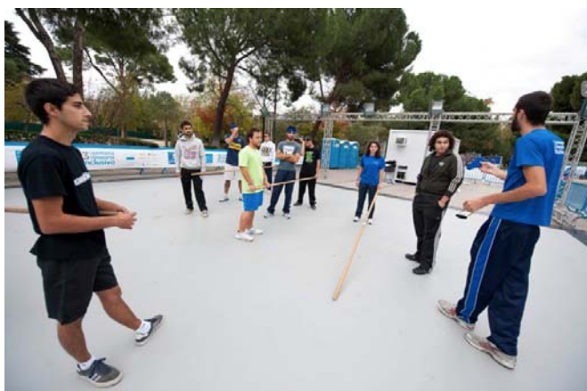
Foto 7. Senderismo para ciegos