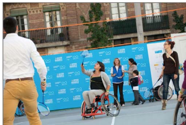
Foto 8. Bádminton inclusivo