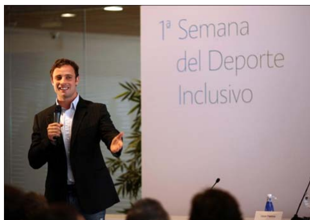
Foto superior 3. Oscar Pistorius, embajador de la I Semana del Deporte Inclusivo.