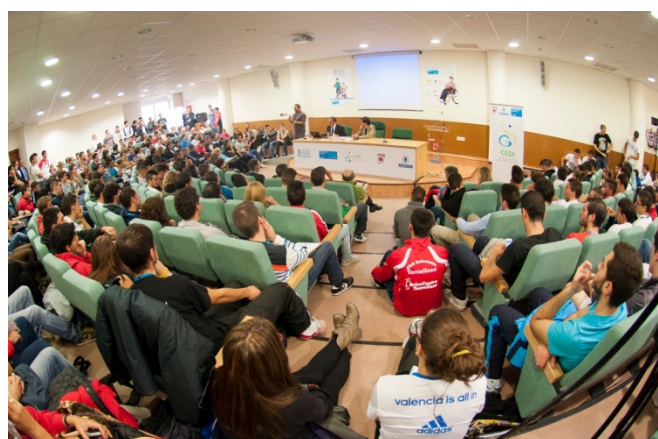
Foto 4. Jornada académica