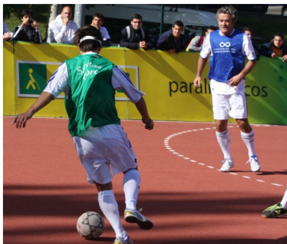
Foto superior 1. Práctica inclusiva de ciegos

VVAA (2006) "Paralympic School Day" (en línea), acceso el 04-10-2012 http://www.paralympic.org/TheIPC/WWD/ParalympicSchoolDay