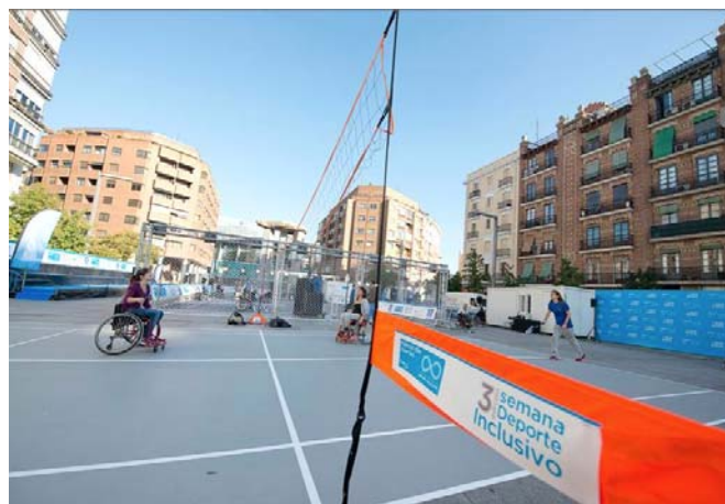
Foto 6. Bádminton inclusivo