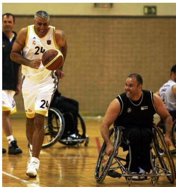
Foto derecha 2. Baloncesto inclusivo de profesionales