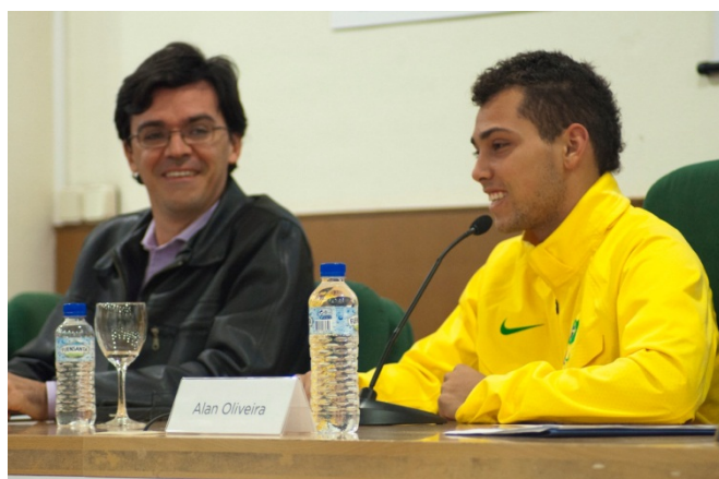
Foto 3. Alan Oliveira, un deportista inclusivo