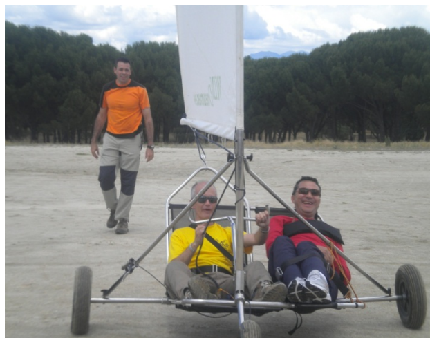
Foto superior. Practica inclusiva de Carrovelas.