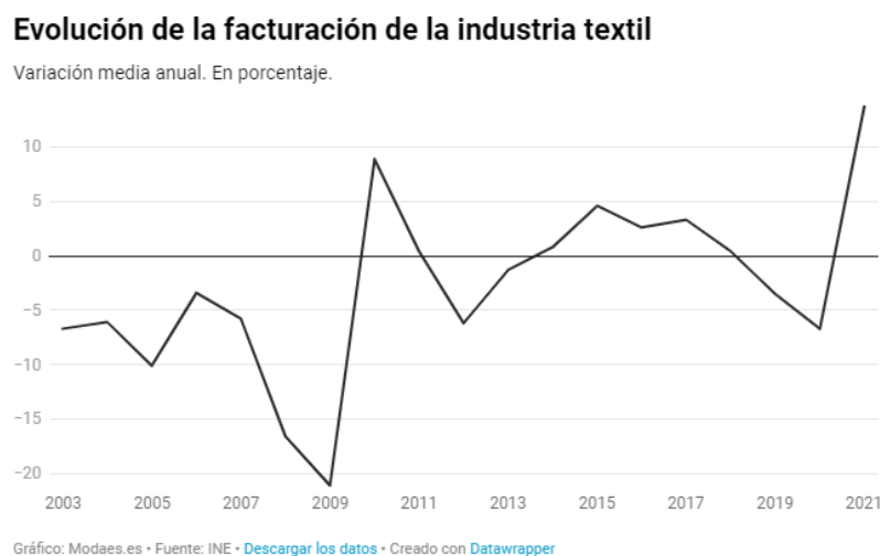
Figura 1: Evolución de la facturación de la industria textil

La industria de la moda genera grandísimos niveles de facturación, tanto a nivel nacional como internacional. 2021 cerró con un crecimiento de su facturación del 13,7% en España, tal y como podemos apreciar en la siguiente figura.