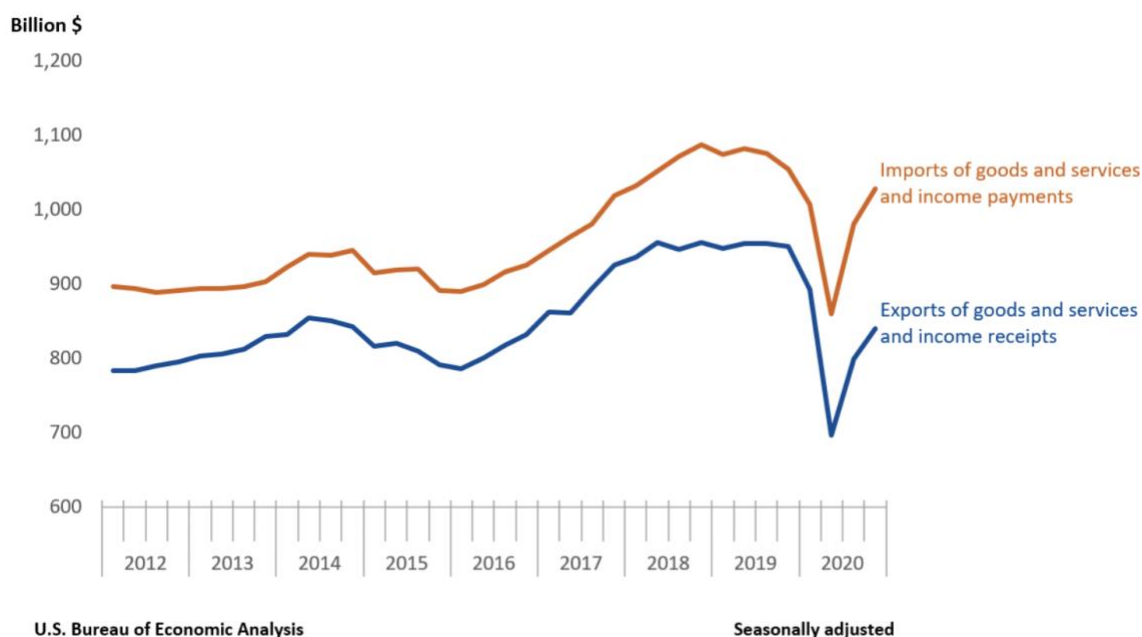
Gráfico II: Transacciones Internacionales de Estados Unidos en el período 2012-2020

Fuente: Bureau of Economic Analysis (2021)