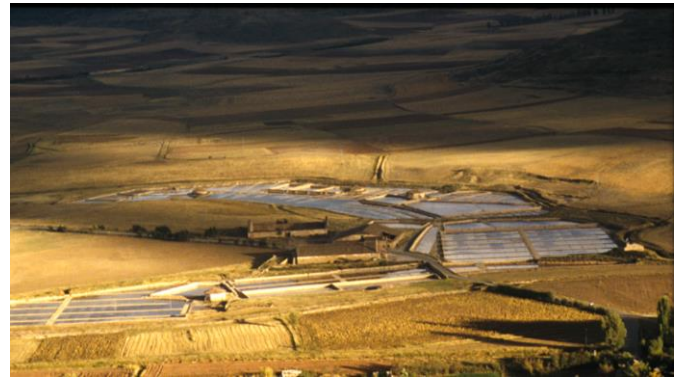
Las salinas de Imón en Guadalajara, uno de los espacios objeto de estudio

explotaciones aisladas en el territorio. Por último, el éxodo rural invitó a los pocos salineros que quedaban a cambiar su oficio por otros físicamente más livianos. Todo ello, si bien de forma muy gradual, fue abocando a muchas salinas al abandono definitivo.