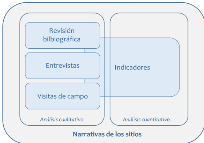
Esquema del enfoque metodológico de la tesis

y visitas de campo a cada espacio. Todo ello combinado permitió elaborar las narrativas de la patrimonialización de cada uno de ellos. En el análisis histórico reciente se partió de una fecha común a todos los espacios españoles, que fue el año en el que se decretó el Desestanco de la Sal (1869). Hay quien dice que ya entonces, por cuestiones que no cabe discutir aquí, se había iniciado el declive de las salinas en España. Y es a partir de entonces cuando sus destinos empiezan a definirse de forma más individualizada. Era importante por ello construir la narración de los pasos que fueron dándose en ellas desde ese momento histórico común.