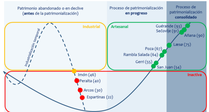
Imagen que muestra la situación del proceso de patrimonialización de cada uno de los espacios estudiados y la relación relativa que hay entre ellos