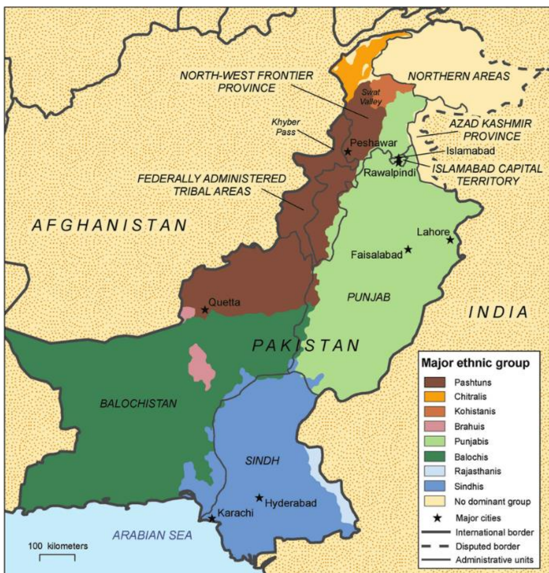
Figura 2: Mapa de la distribución de las diferentes etnias de Pakistán

Estos grupos étnicos reflejan la diversidad de Pakistán y su compleja estructura social. Sus interacciones y tensiones con el estado paquistaní resaltan los desafíos que enfrenta Pakistán en la gestión de su diversidad étnica y cultural. Mientras el estado ha intentado promover una narrativa nacional unificada, a menudo en torno al urdu y el Islam, los distintos grupos étnicos han continuado luchando por el reconocimiento y la autonomía, evidenciando la compleja dinámica entre etnicidad, nacionalismo y política en Pakistán. (Levesque, J, 2013)