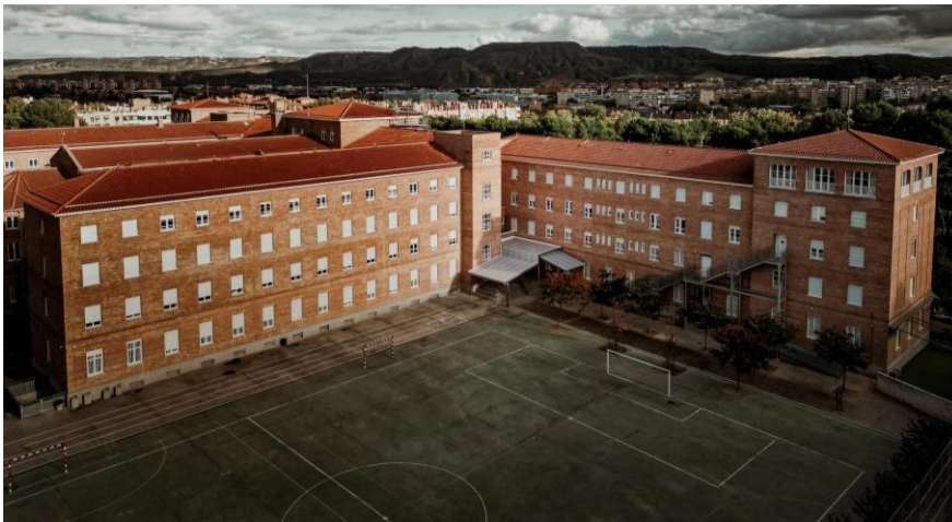
Colegio San Ignacio de Loyola