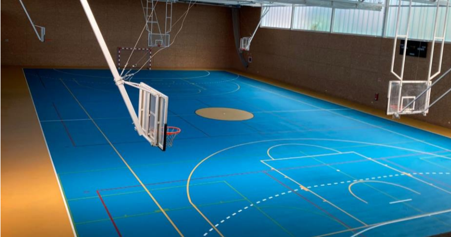
Polideportivo del Colegio San Ignacio de Loyola