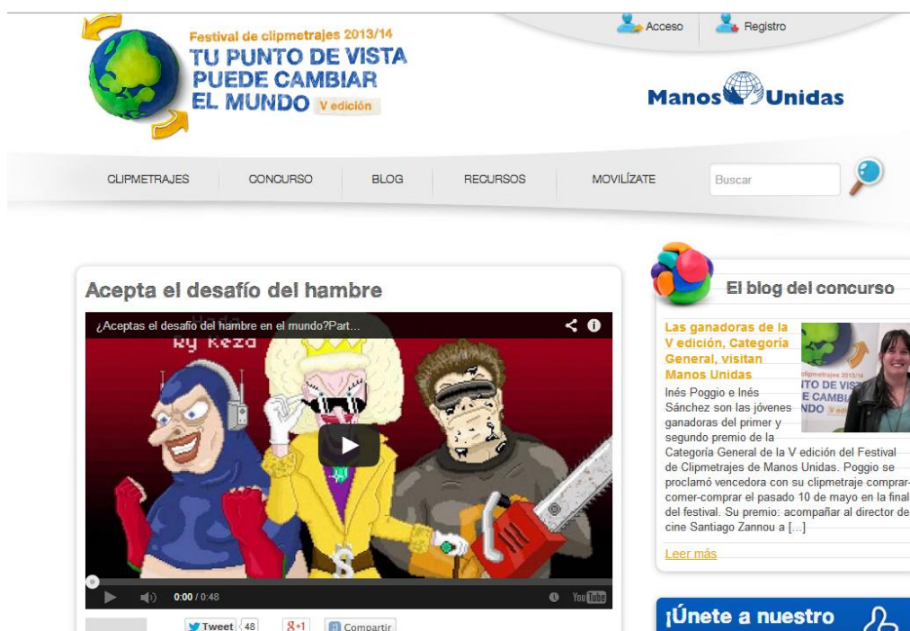
Ilustración 3: Concurso de Clipmetrajes para escolares