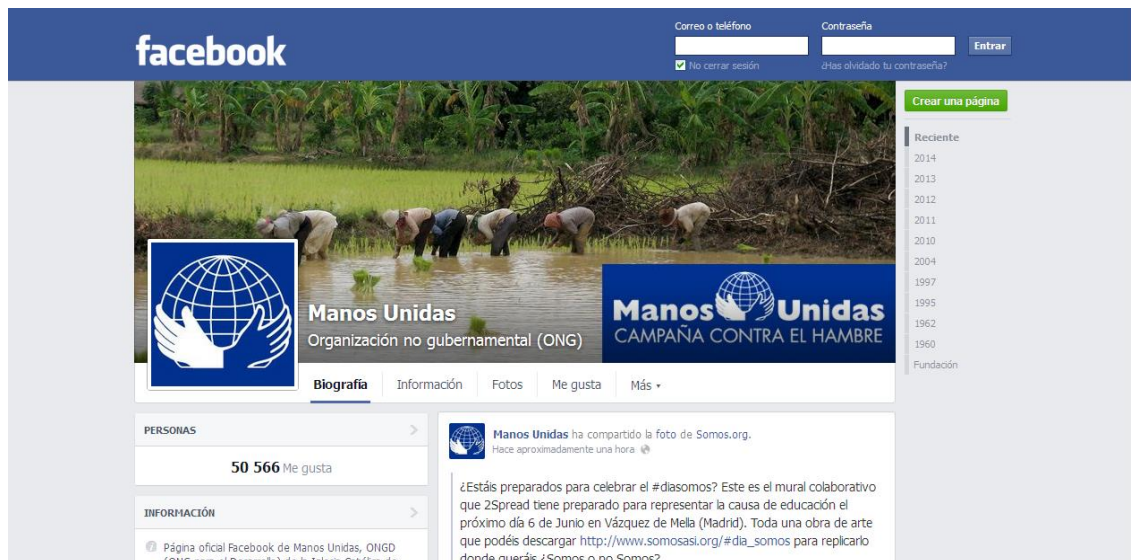
Ilustración 6: Manos Unidas en las redes sociales

Por último, señalar que de los 14 indicadores incluidos en la matriz de evaluación a modo de hipótesis, el análisis factorial ha demostrado que se pueden reducir a 12: (1) pertinencia, (2) eficacia-eficiencia, (3) aspectos metodológicos y contenidos, (4) participación, (5) nuevas tecnologías, (6) viabilidad-sostenibilidad, (7) cobertura, (8) coherencia, (9) visibilidad, (10) coordinación-trabajo en red, (11) apropiación y (12) calidad pedagógica.