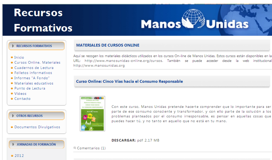
Ilustración 4: Cursos online