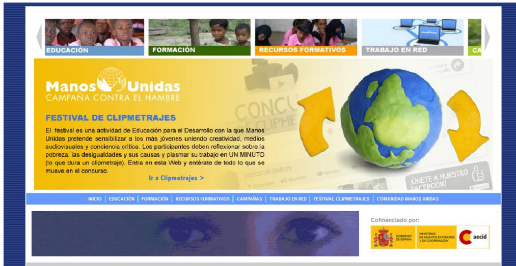
Ilustración 5: http://www.manosunidas-online.org/