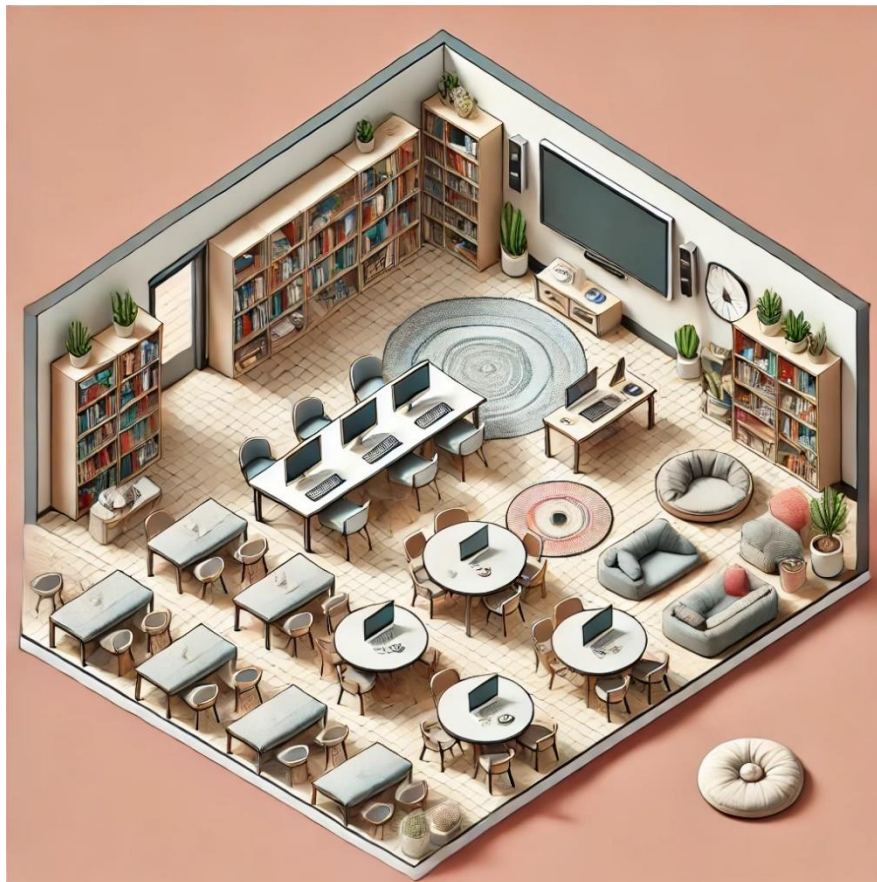
Ilustración 1. Plano Aula

zona de meditación u oración y la de trabajo. La clase cuenta con 5 mesas para trabajar de forma cooperativa y por ello cada mesa, conforma un equipo de 4 o 5 personas. También, la parte de la asamblea contará con una alfombra, para que sea un espacio de acogida y con una estantería para los distintos materiales que se utilizarán. Por otro lado, contamos con el espacio de meditación y oración, donde habrá colchonetas y cojines, para que los alumnos sientan cierta comodidad y habrá una estantería donde encontraremos libros de oraciones, cuentos o libros para una lectura profunda. De igual modo, habrá otro espacio dedicado a los momentos en los que los alumnos tengan que buscar información o para utilizar los recursos interactivos complementarios a los contenidos que daremos. Además, en una esquina de la clase habrá una pequeña biblioteca, donde los alumnos podrán consultar y leer libros relacionados con los contenidos de la materia. Por último, el docente también contará con un espacio, donde encontraremos el ordenador del aula y donde podrá controlar todo aquello que esté relacionado con el proyector.