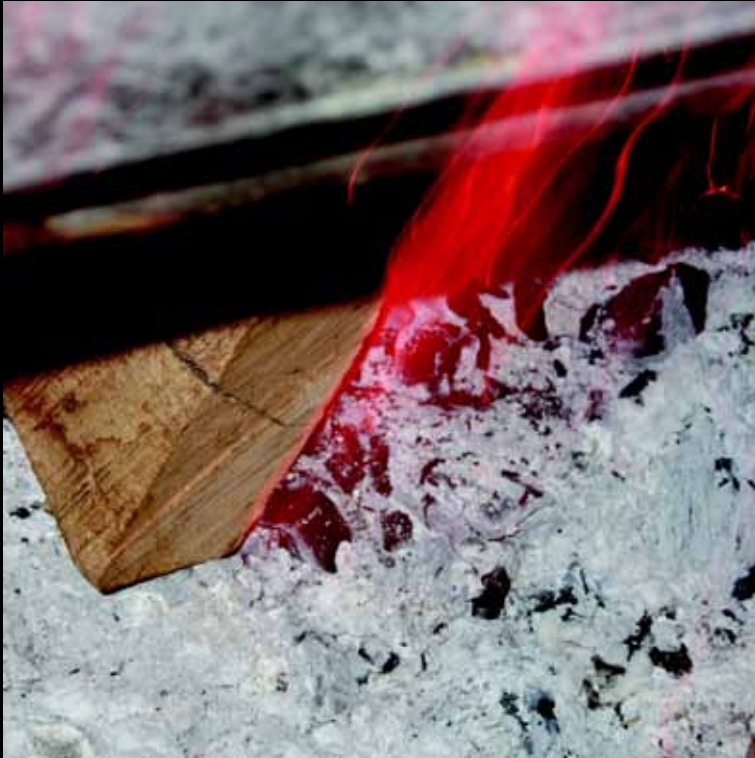
Cecilia Montagut “Rescoldo”