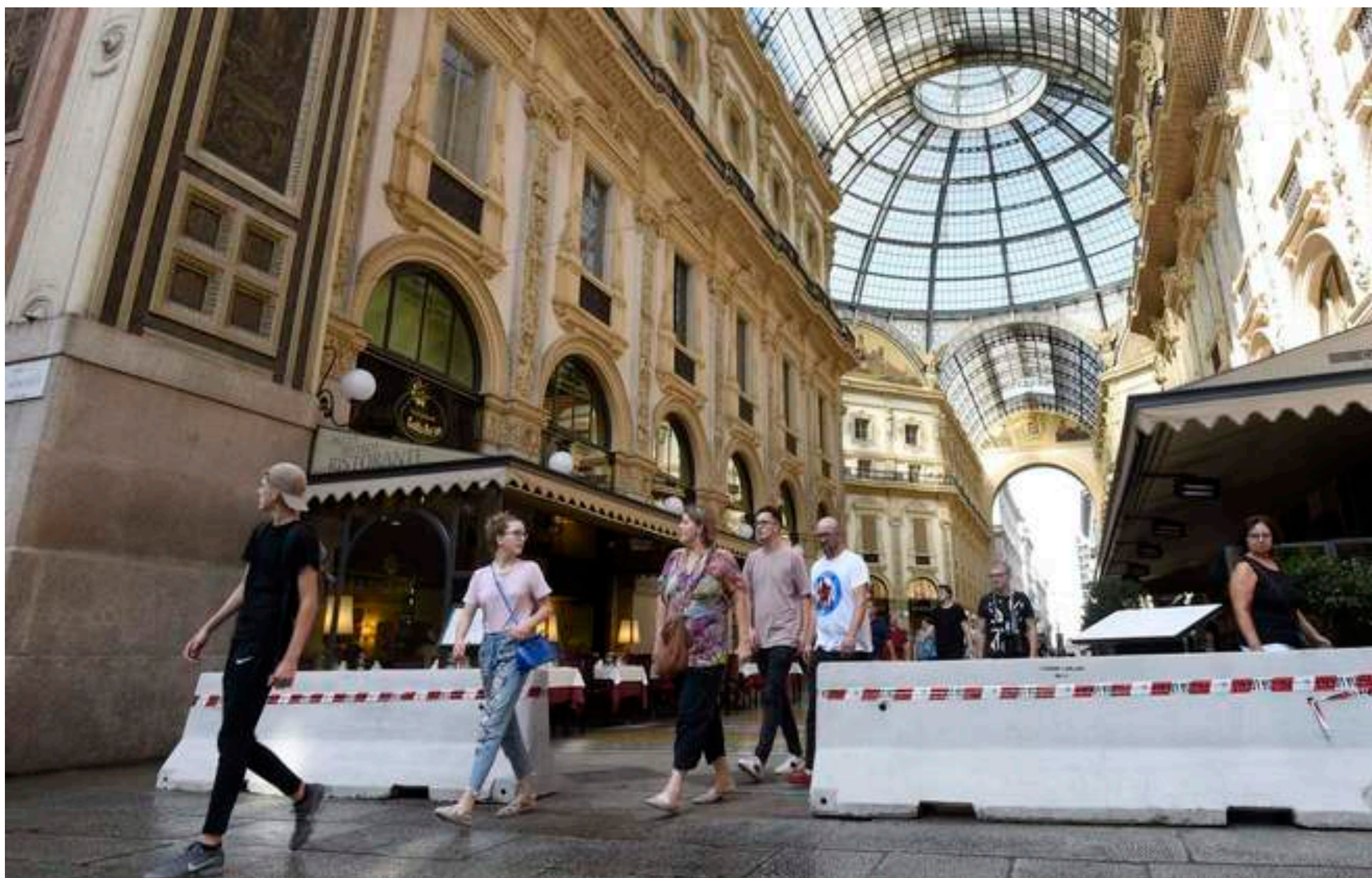
Bloques de hormigón como sistema de prevención en la ciudad de Milán.

Aunque para los estudiosos del fenómeno terrorista un atentado como el de Barcelona era plausible, la población española no era consciente de la alta probabilidad. Debemos asumir que no existe la seguridad total, pero el atentado nos sugiere una serie de lecciones aprendidas que podrían servir para reducir las opciones de un suceso similar en el futuro.