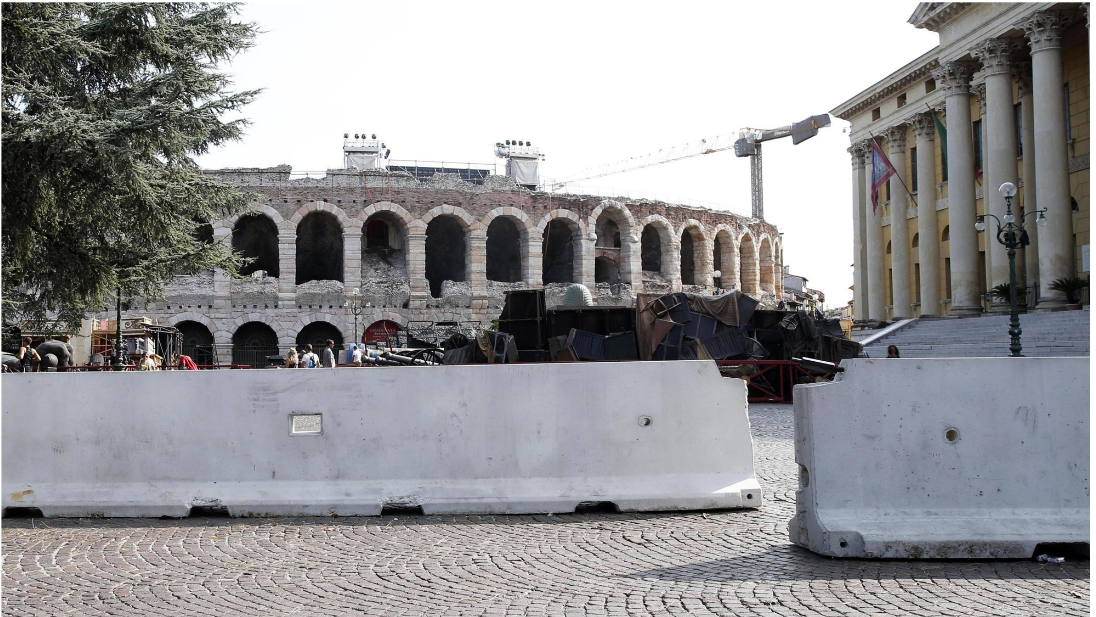
Verona también ha situado barreras de contención.

Nacional y Guardia Civil se han reducido en un 9,2% y un 12,6%, respectivamente, desde 2011. En el caso de las ciudades autónomas, si bien es cierto que son los dos únicos territorios donde se han incrementado los efectivos de las fuerzas de seguridad, la mayor parte de los yihadistas que han acudido a Siria e Irak desde España proceden de allí.