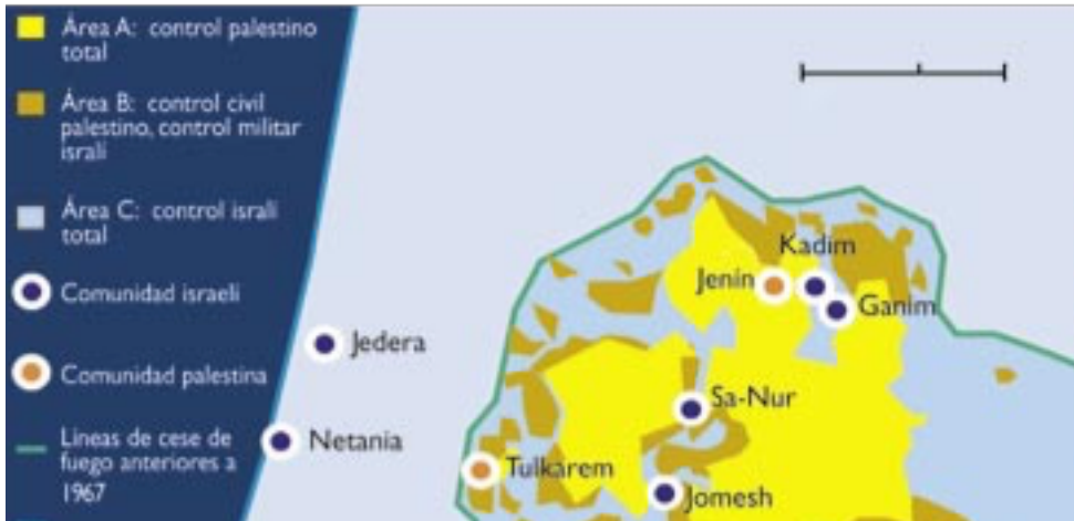
Fuente: El Plan de Desconexión: Reanudación del proceso de Paz Israelí, 2005