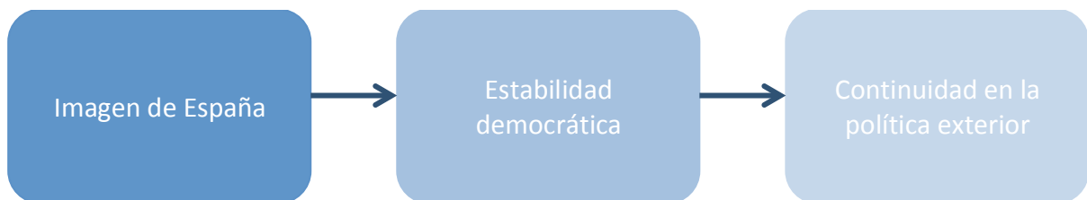
Gráfico 1: Hipótesis de trabajo.

Es decir, la variable independiente se corresponde con la imagen de España en el exterior como estabilizador democrático , mientras que la dependiente es la continuidad en la política exterior de España.