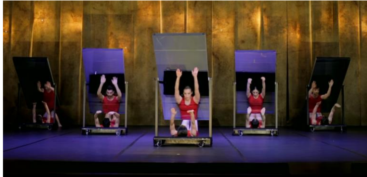
Figura 2: Juego con espejos. En matemáticas apoyan el estudio de las simetrías, en danza pueden ser utilizados como en este montaje.