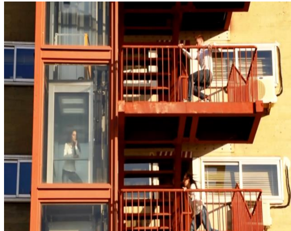
Figura 7: "Mi leitmotiv: encontrar los lugares ocultos en la arquitectura". Federico Babina.