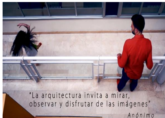
Figura 6: La Arquitectura está pensada para disfrutar de la mirada. Es, en esencia, estética.