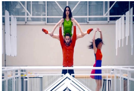
Figura 5: "La arquitectura es la ordenación de la luz; la escultura es el juego de la luz". Antonio Gaudí.