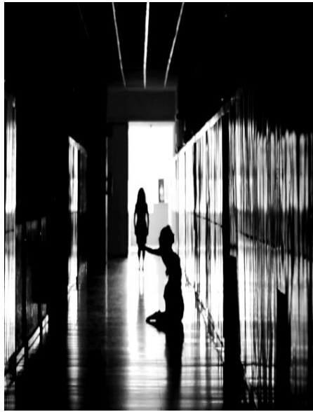
Figura 4: Arquitectura es perspectiva, punto de fuga.