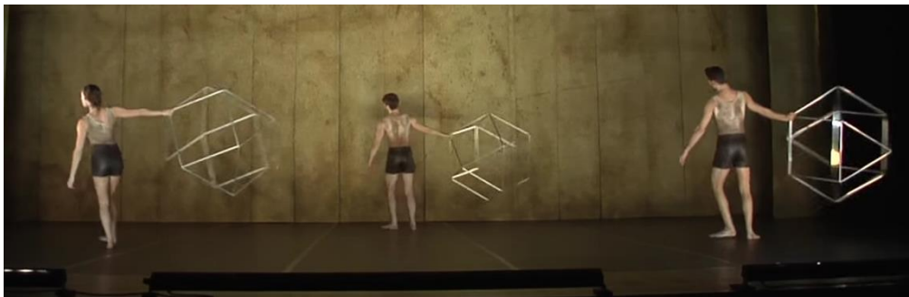
Figura 3: Poliedros: figuras geométricas de gran importancia en matemáticas y en construcción que cobran protagonismo en el baile.

Este tipo de coreografías puede ayudar a los docentes a motivar e inspirar a sus alumnos, así como a introducirlos en ciertos conceptos técnicos del mundo de la ingeniería, la arquitectura o la ciencia en general.