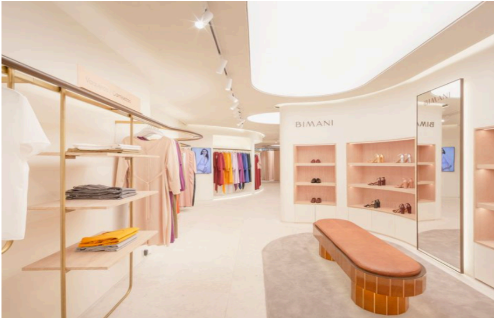
Ilustración 2: Punto de Venta Valencia