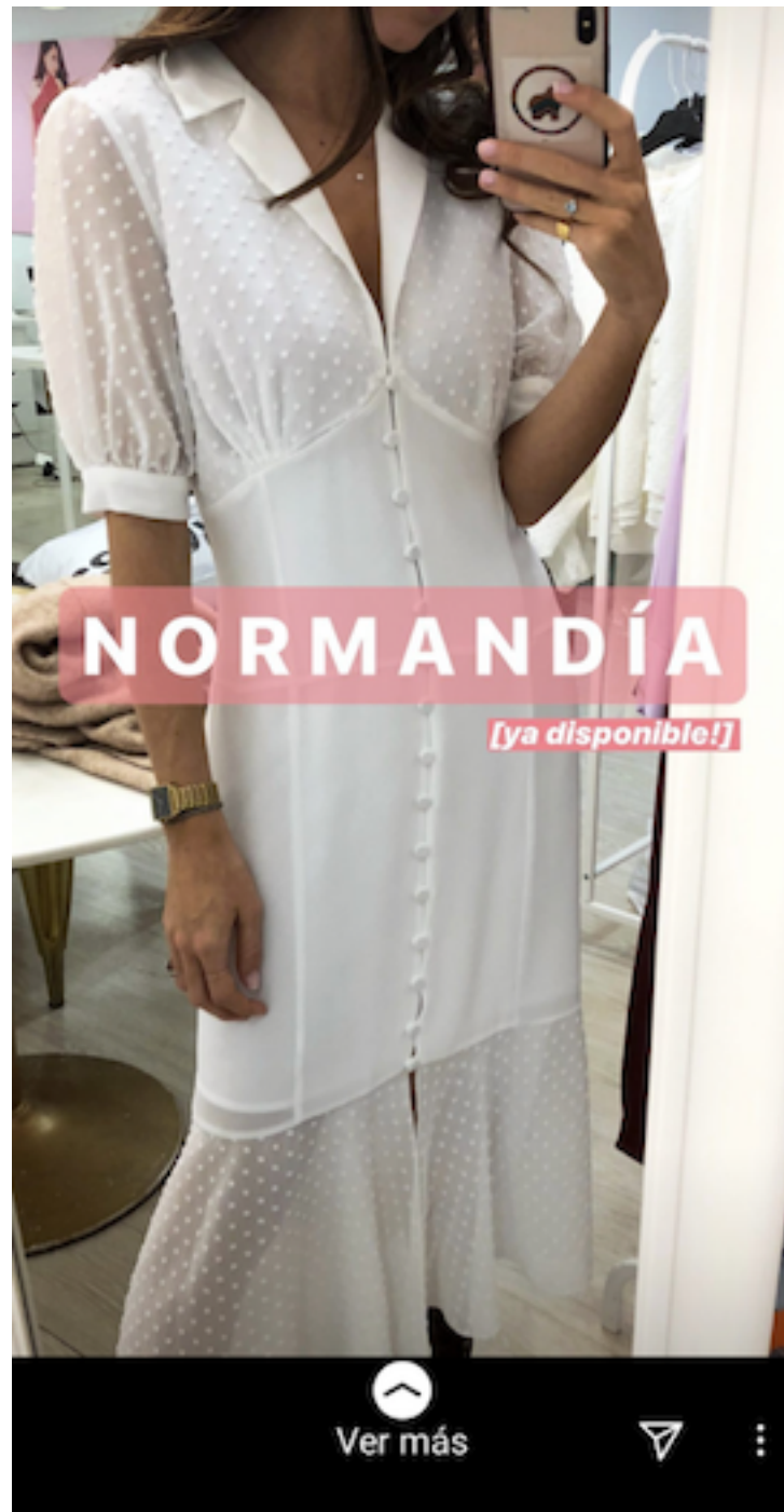
Ilustración 4: Instagram Stories de BIMANI