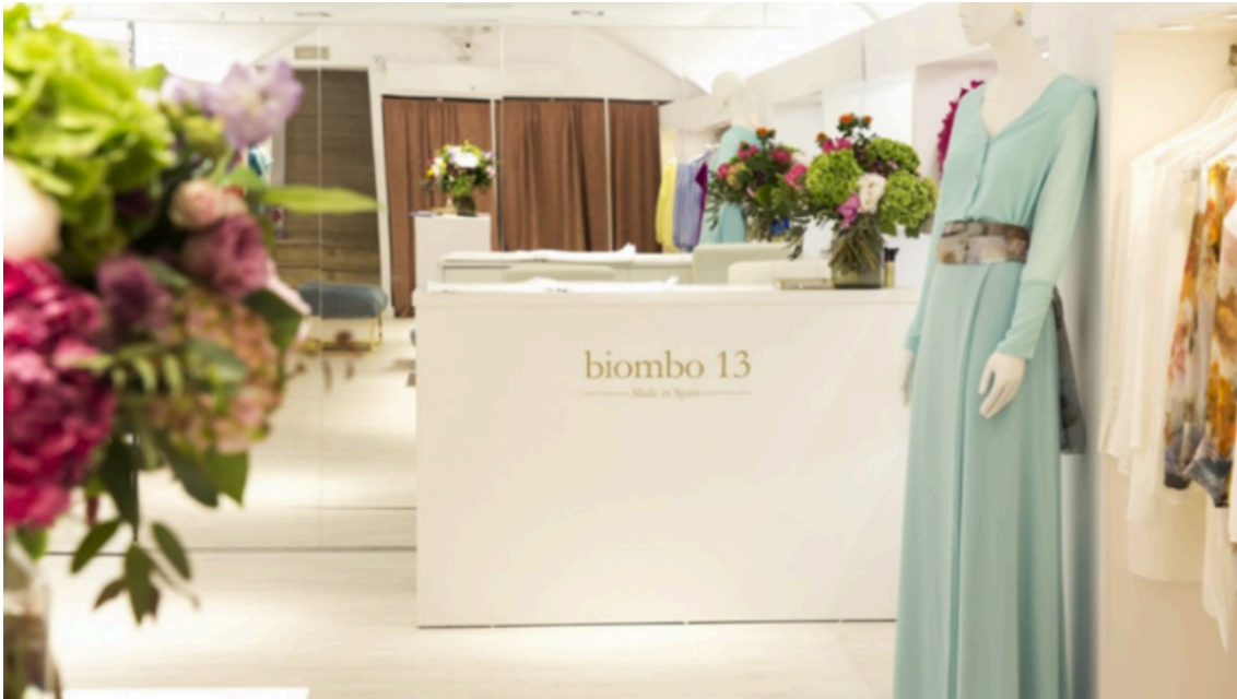
Ilustración 1: Punto de Venta Paseo de la Habana