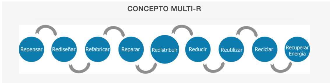
Ilustración 6 : Concepto multi-R