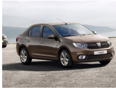
Ilustración 10 : El modelo del coche Dacia Loga

lugar posteriormente a una gama completa, que hoy en día permite a Dacia ofrecer coches con prestaciones equivalentes a las de la competencia a precios mucho más bajos.