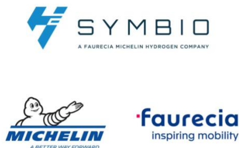
Ilustración 5: Logo de Symbio Michelin y Faurecia

Así, con este ejemplo, podemos observar que adaptarse al cambio presente en la actualidad permite innovar para destacar en su mercado, mejorar la productividad, reducir sus costos y establecer nuevas asociaciones.