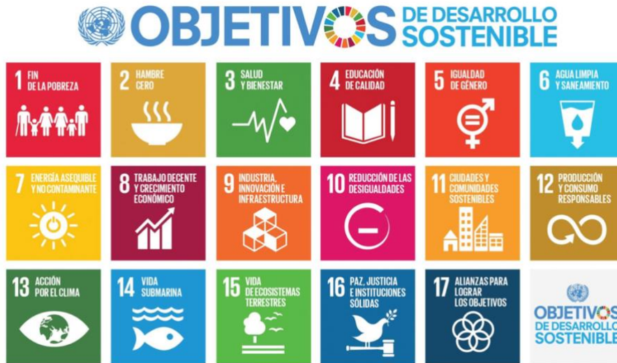
Ilustración 1: Los 17 objetivos de desarrollo sostenible