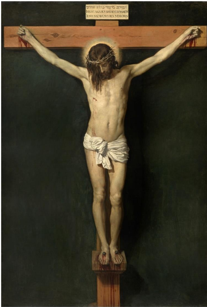
Diego Velázquez, Cristo crucificado , hacia 1632 Óleo sobre lienzo, 248 x 169 cm. Museo del Prado, Madrid

Jesucristo, que se hizo hombre, vivió la soledad hasta el extremo. La pintura de Velázquez Cristo crucificado expresa bien la soledad suprema de Jesús en su muerte de cruz. En esta obra no aparecen otras figuras como María o el discípulo amado, solo Jesús. El fondo opaco y vacío resalta la completa soledad de Jesús que está solo en la cruz 190 .