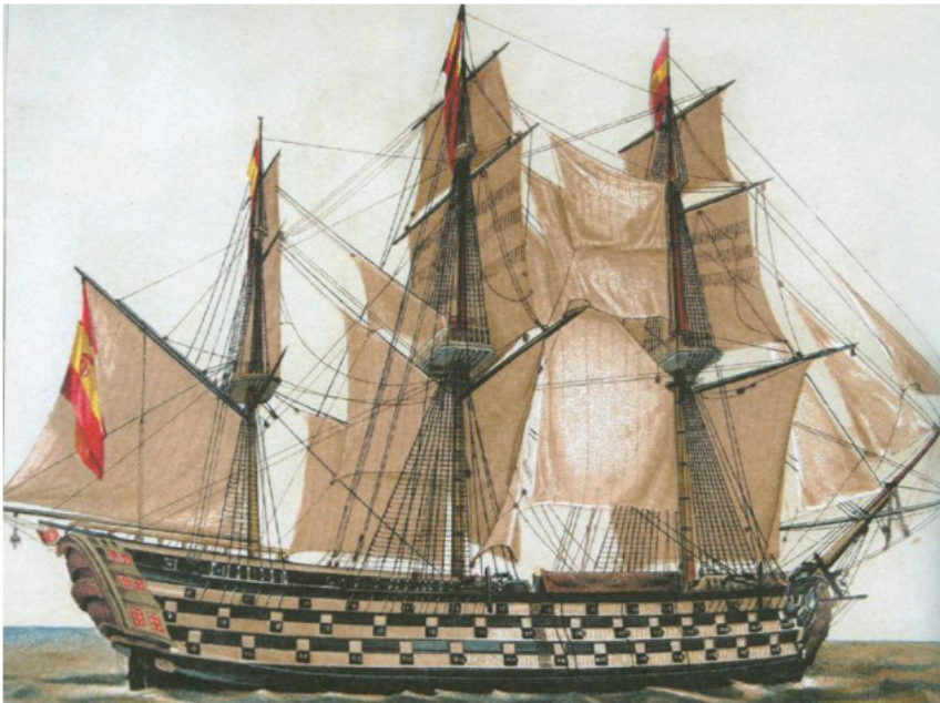
Ilustración 10. Bajel Santa Ana de 112 cañones. Grabado del siglo XIX

Finalmente, se encuentra el “bajel”. Se trata de un tipo de embarcación de carácter militar, caracterizado por su solidez y fuerza. Esto le permitía desempeñar travesías de larga distancia, sin incurrir en grandes costes de manutención. De este modo, este tipo de embarcación se encargó de escoltar a los buques mercantes en su travesía a América, y, por tanto, desempeñaron un rol fundamental en el sistema de flotas.