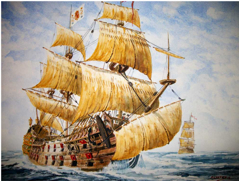
Ilustración 7. Pintura de un Galeón del siglo XVII

XVI, tras sustituir a otro tipo de embarcaciones previas, como son las naos y las carracas. 12 Los Galeones, se caracterizan por ser embarcaciones de grandes dimensiones y potencia, y por su falta de agilidad y velocidad. Se trata de una embarcación destinada tanto a fines militares, como al comercio y transporte de bienes.