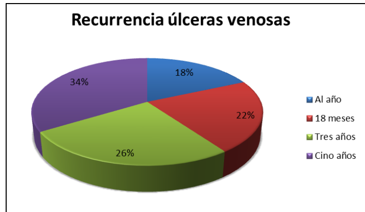
Figura 1. Recurrencia UV. Elaboración propia a partir de los artículos de Revisión en úlceras venosas: epidemiología, fisiopatología, diagnóstico y tratamiento actual, y What's new: Management of venous leg ulcers: Treating venous leg ulcers (19,20).

Respecto a la edad de inicio de la IVC, se estima que comienzan a partir de los 20 años, presentando un vértice a los 40 – 50 años y disminuyendo a partir de los 70 años. Esto está relacionado con la actividad realizada diariamente y la postura mantenida durante largos periodos de tiempo, por ejemplo permanecer muchas horas sentada o en bipedestación(21).