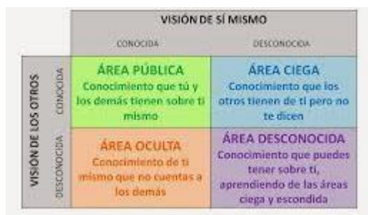
Figura: la ventana de Johari. (E. Vera, 2013)

El significado de la construcción de la identidad.