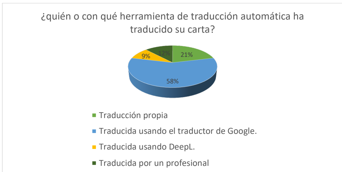
Figura 2: Encuesta acerca de la autoría de la traducción.