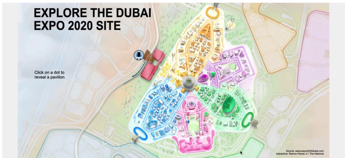
Tabla 4. Mapa de la EXPO 2020 de Dubái.