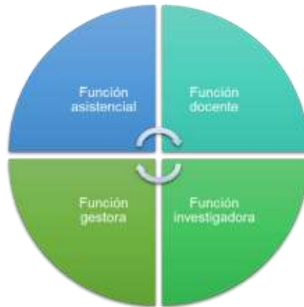
Figura 2. Funciones de la enfermera escolar. Elaboración propia. 22

La enfermería escolar se encuentra integrada dentro de la especialidad de enfermería comunitaria, abarcando todas las competencias profesionales propias de la enfermería como son: asistencial, docente, investigadora y de gestión.