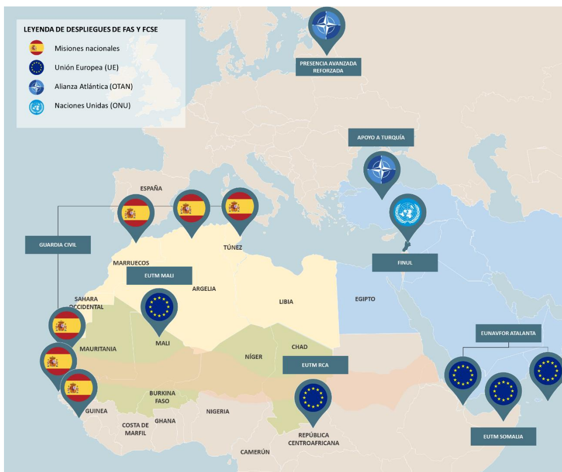
Figura 2. Despliegue geográfico de las misiones y operaciones 1 en el exterior

La FAS mantienen una presencia permanente en el exterior participando en misiones de vigilancia y seguridad, así como en diversas misiones internacionales. España está presente en algunas misiones destacadas en el mediterráneo, representadas en la Figura 2 .