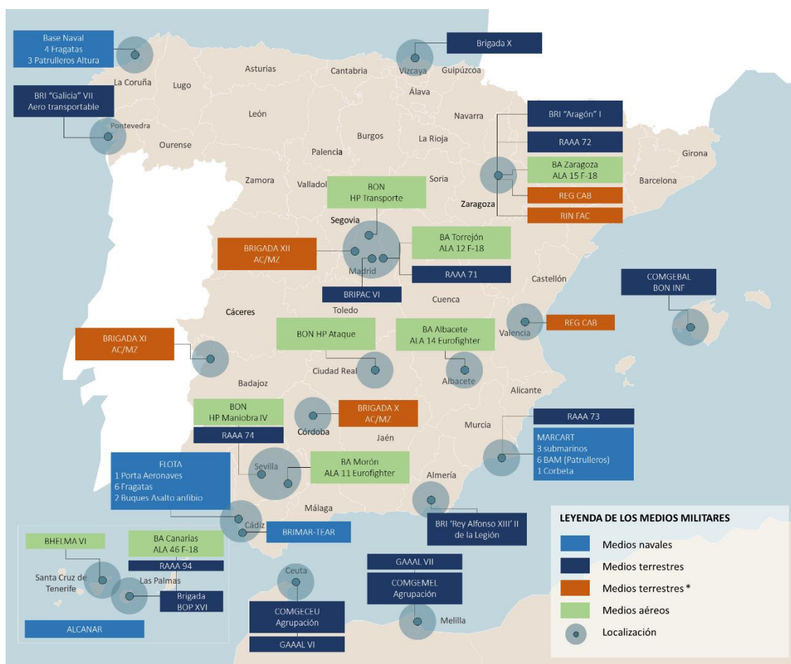
Figura 3. Despliegue nacional de las capacidades militares

* Unidades de maniobra con mayor potencia de combate.