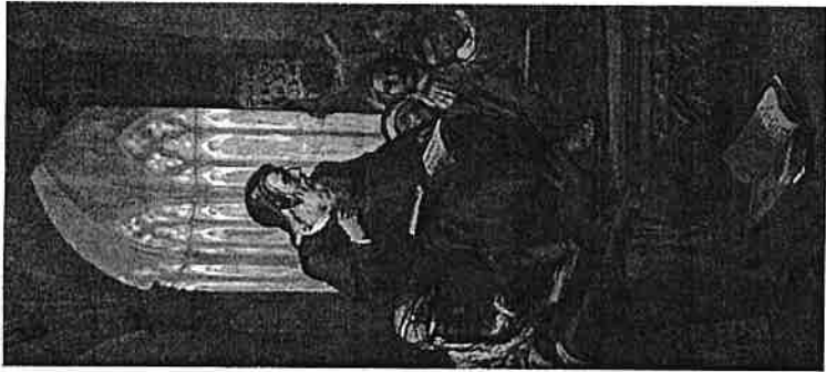
Fig. 43. Ramon Llull , Ricard Anckermann, Palau del Rei Sanç, 1874.